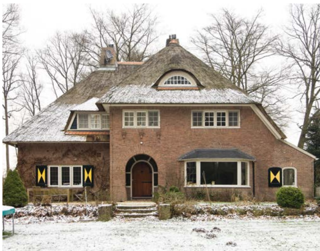
Vrijstaande villa in Lochem (1921). J. v. Galen 2010